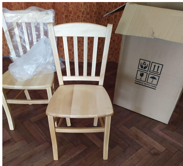
Nové židle na kulturním domě

Zastupitelstvo schválilo, že odpady pro rok 2024 zůstanou pro občany bez navýšení, tudíž 700 korun na osobu a rok . (Liku a.s. bude obec platit 1074 korun za osobu a rok.)