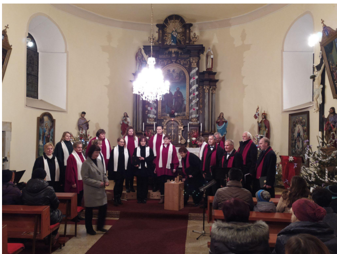
Pěvecký sbor Dalibor

Přijďte si i v roce 2024 poslechnout smíšený sbor Dalibor, jejich vystoupení nás čeká hned na začátku ledna.