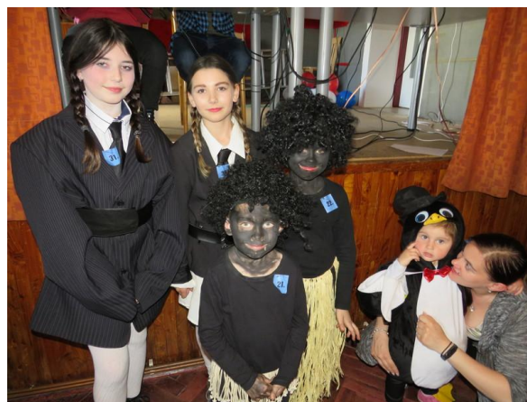
Z některých masek šel i trochu strach