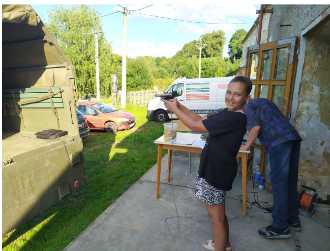
Střelnice ve vojenském autě