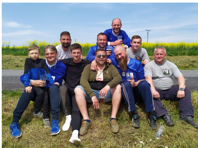
Hrstka našich hasičů

Příští rok se okresní hasičská soutěž koná v Opatovci, nebudeme ale předbíhat, přijedme jim fandit.