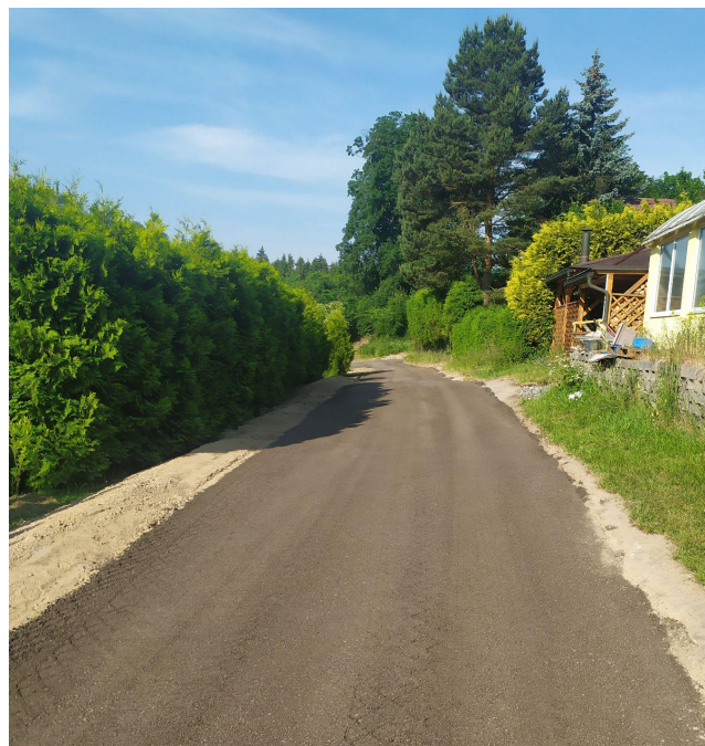
Nová cesta na Vysokém Poli

Cena vodného se navyšuje na 55 korun za 1 m 3 vč. DPH .