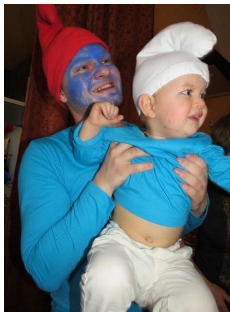
Tatka šmoula se šmoulikem

V naší obci se dětský karneval nekoná klasicky na podzim, ale na jaře. A možná i proto je účast vždy obrovská. Každoročně se karnevalu účastní široká věková škála dětí, od téměř novorozenců až po deváťáky, tu a tam se objeví v masce i dospělý.