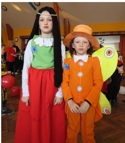
Vítězné masky: Maková panenka a motýl Emanuel

Nejen na výherce, ale na všechny masky čekal stůl plný odměn, ze kterého mohli pro sebe vybrat to nejlepší.