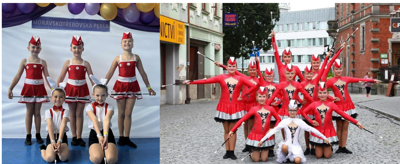
Mažoretky Violette a jejich trenérky

V nadcházejícím novém roce přejeme všem hodně zdraví, pohody a krásných zážitků prožitých v kruhu rodiny a přátel.